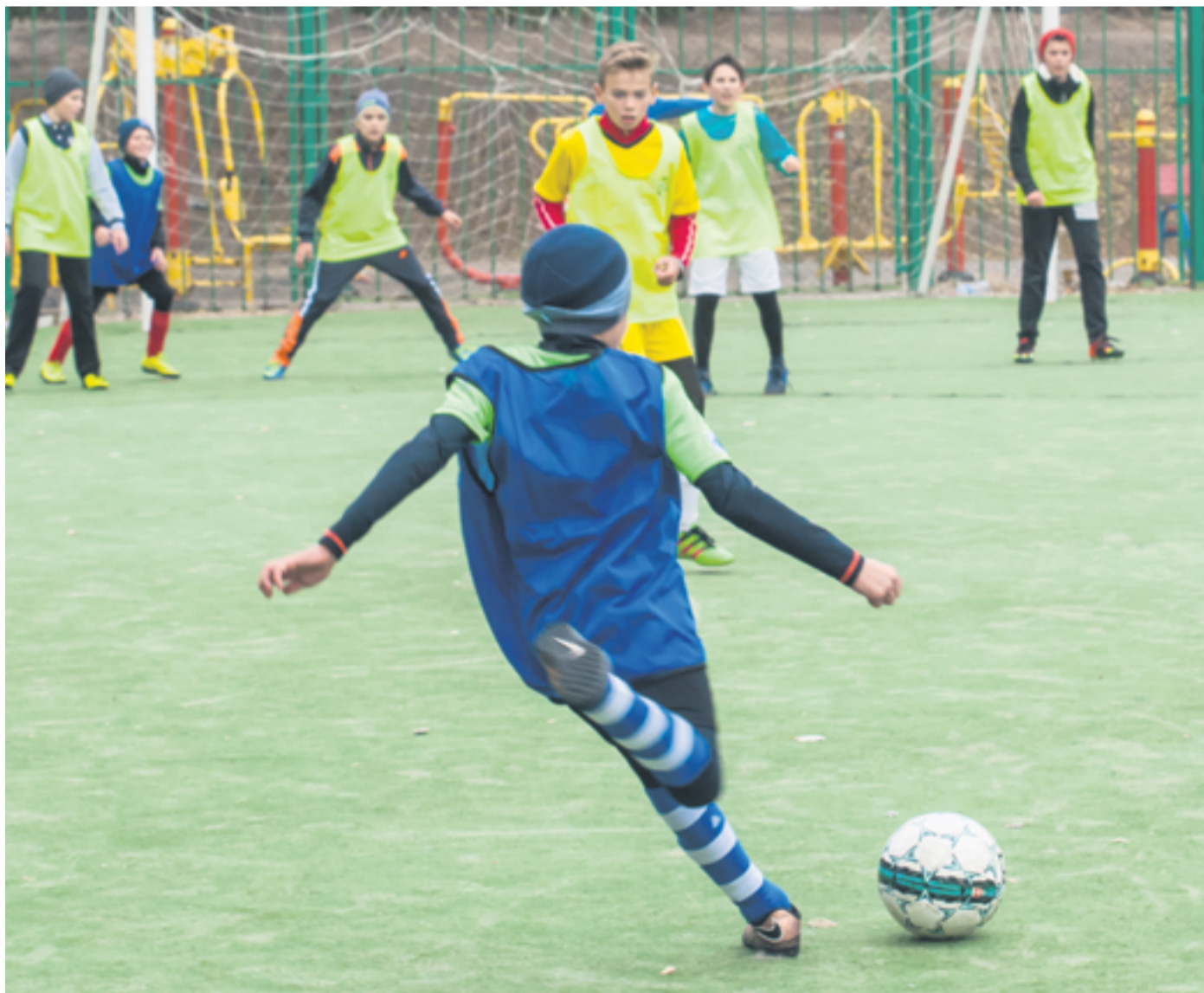
На Татарці започатковано футбольний турнір серед школярів