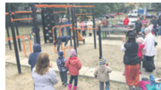
На окрузі встановлено спортивні майданчики в рамках програми мера «Спорт – доступний кожному»

Шановні мешканці Татарки! Дорогі сусіди! Рік тому Ви віддали за мене свій голос, підтримали мене на виборах. Я вкотре дякую Вам за довіру. Ви знаєте, що це мій перший рік у Київській міській раді. Я намагався зробити багато справ за цей період, і чимало справді вдалося. Хоча, зізнаюся – інколи було дуже непросто.