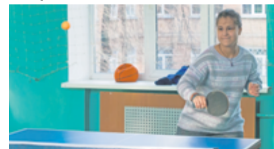
Школярі Татарки боролися за звання «найкращої ракетки»