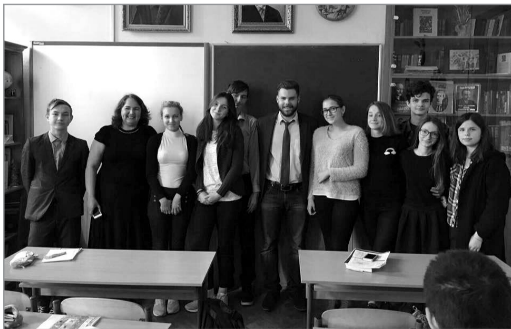
Лекція для учнів школи №138 про українського поета, літературознавця, перекладача Василя Стуса, засудженого за свої переконання на 12 років позбавлення волі

Ще раз дякуємо матерям за їхні присвячені нам життя!