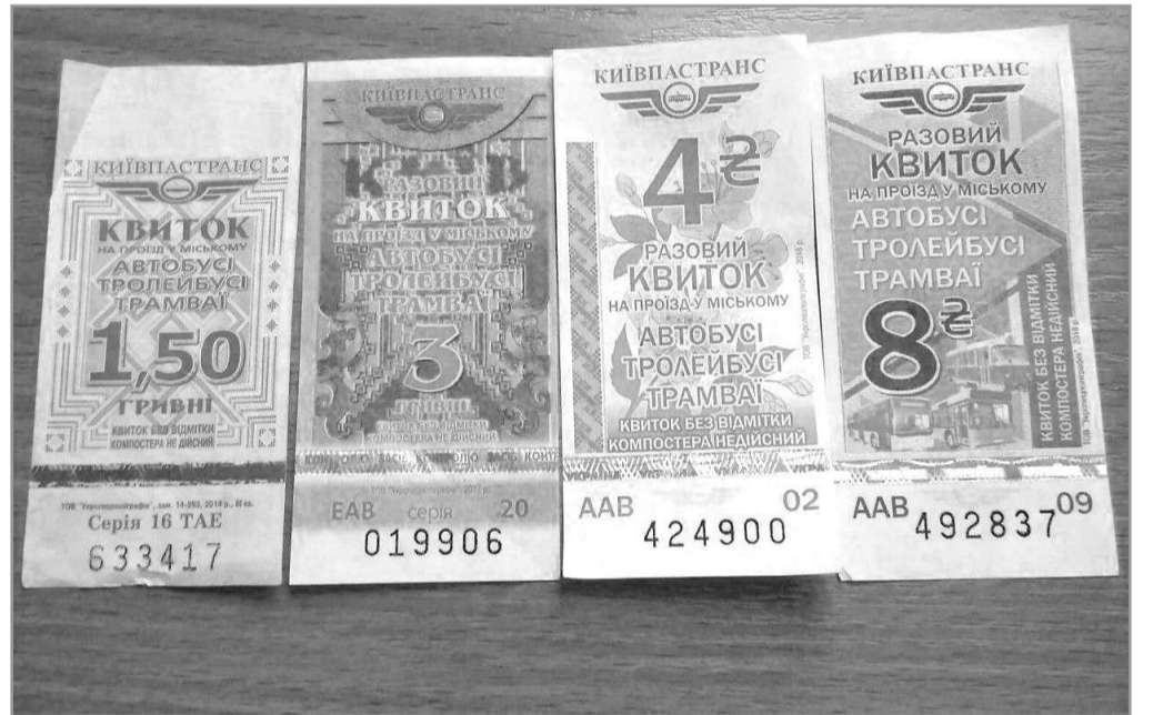
За останні три роки влада Кличка збільшила вартість проїзду більш як в п'ять разів

Тепер кожен киянин може побачити, хто за людей, а хто за збільшення збору чорного налу в кишеню чиновників.