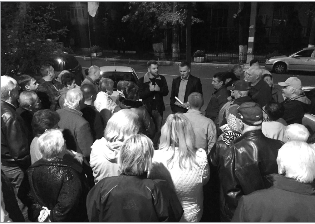
Зустріч депутатів з мешканцями постраждалих будинків від приватної котельні "Бонвояж"