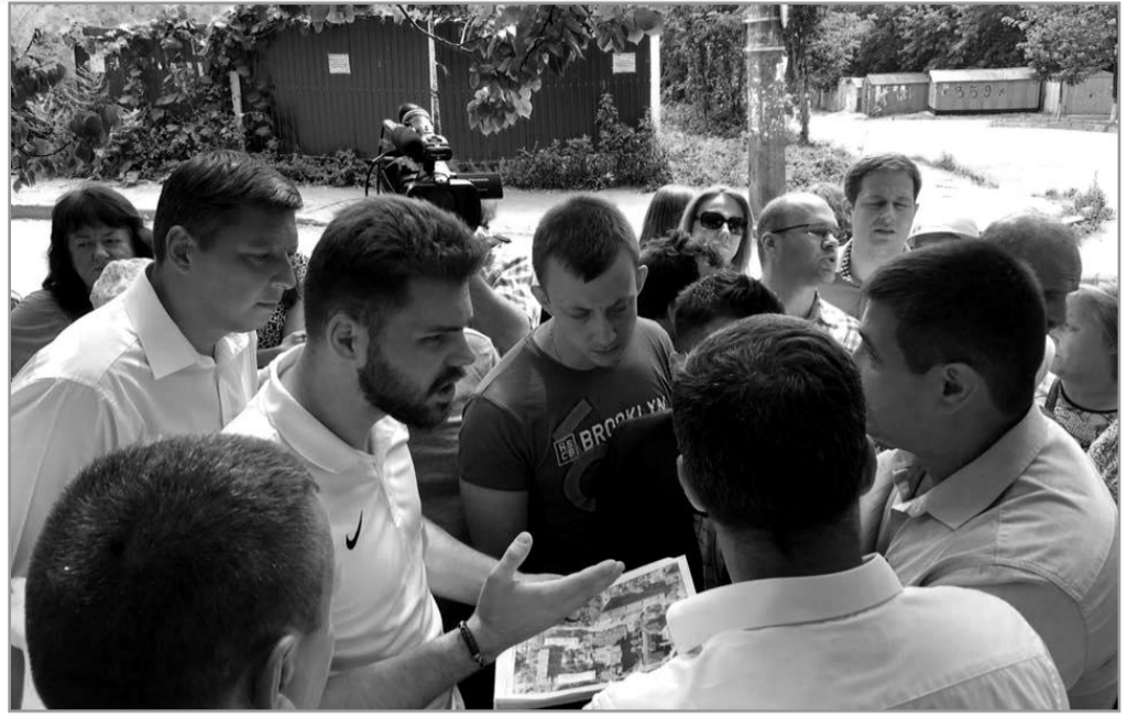
Віздне засідання транспортної комісії щодо самозахвату забудовником ділянки по пров. Татарському, 2. Деталі на с. 4

ною площею 0,23 га, були передані в оренду так званому «Торговому представництву Республіки Таджикистан в Україні» в 2007 році. Орендар не користувався ділянкою протягом терміну оренди, а подання клопотання про поновлення договору відбулося з грубим порушенням строків, визначених законодавством.