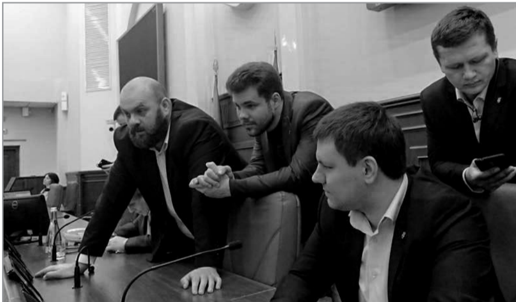
Розклад роботи приймальні депутата Київради Святослава КУТНЯКА та народного депутата України Юрія ЛЕВЧЕНКА

"Свободівці" блокують сесію з вимогою притягнути до відповідальності винних у побитті людей