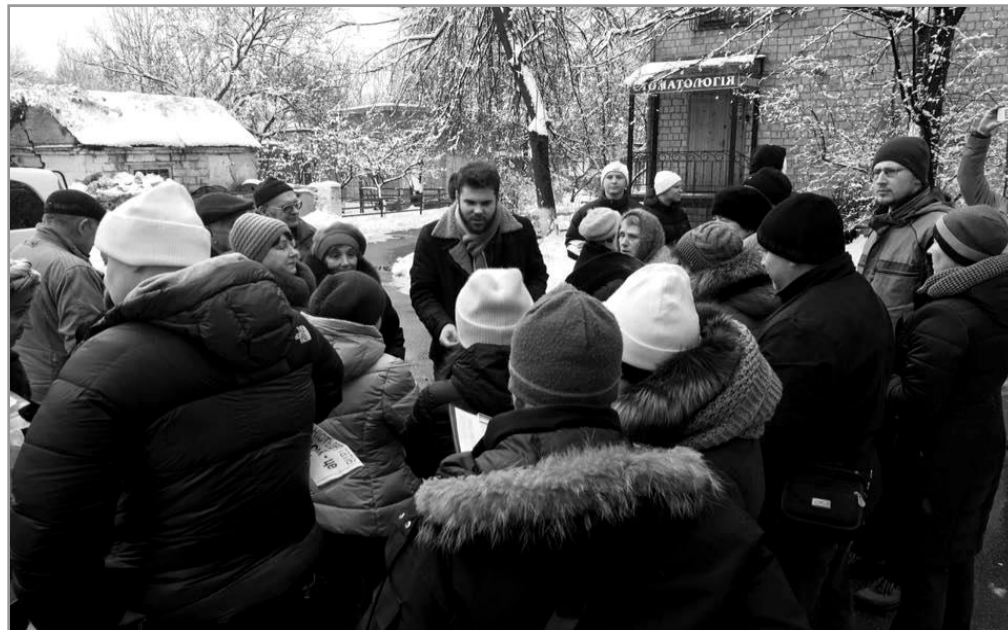
Зустріч Святослава Кутняка з мешканцями мікрорайону щодо розгляду проблемних питань фінансування ОСББ та ЖБК Шевченківського району та столиці загалом

Загалом, толоки по нашому мікрорайону завдяки активним мешканцям є регулярним явищем. Окрім провулку Татарського толоки проводилися на вул. Отто Шмідта, 26-б та інших територіях району.