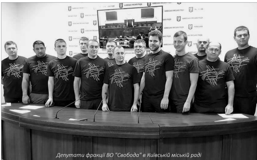
Депутати фракції ВО "Свобода" в Київській міській раді

Наступного ж дня я відправив письмове клопотання на Кличка, аби той якнайшвидше підписав моє рішення і відхилив клопотання про продовження договору. Тепер позиція мера стане зрозумілою - громада чи забудовники!