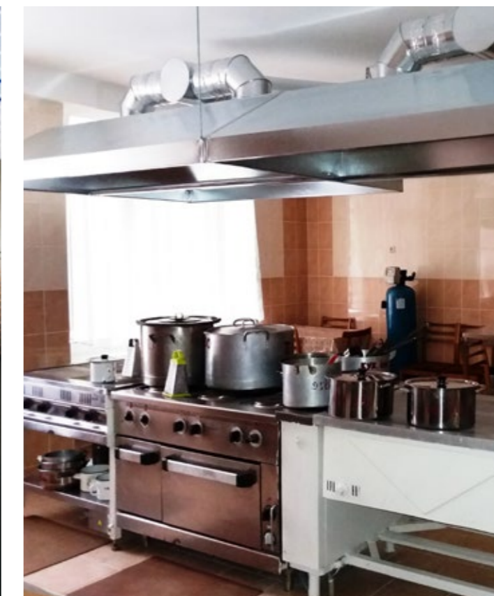
КАПІТАЛЬНИЙ РЕМОНТ ХАРЧОБЛОКУ В ДИТЯЧОМУ САДОЧКУ №687