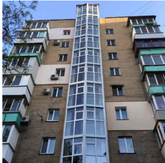
НОВІ ВІКНА У БУДИНКУ НА ВУЛ. ВИБОРЗЬКІЙ, 49

2017 року у 22 будинках округу проведено заміну старих аварійних вікон на нові металопластикові. Це підвищує їх енергоефективність, теплоізоляцію під час опалювального сезону, забезпечує економію теплової енергії та поліпшує естетичний вигляд будівель в цілому.