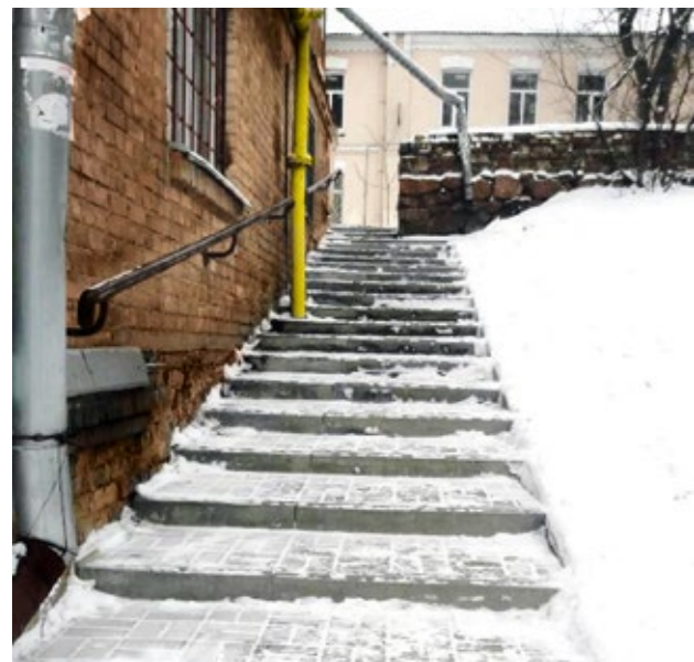
НОВЕНЬКІ СХОДИ БІЛЯ БУДИНКУ НА ВУЛ. ВИБОРЗЬКІЙ, 87

2017 року у 22 будинках округу проведено заміну старих аварійних вікон на нові металопластикові. Це підвищує їх енергоефективність, теплоізоляцію під час опалювального сезону, забезпечує економію теплової енергії та поліпшує естетичний вигляд будівель в цілому.