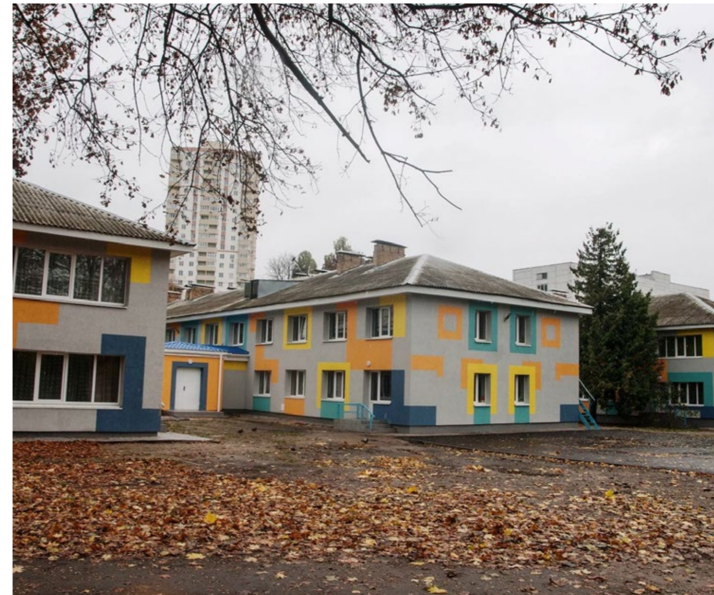
КАПІТАЛЬНИЙ РЕМОНТ ФАСАДУ В ДИТЯЧОМУ САДОЧКУ №225