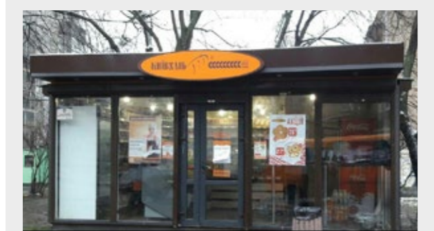
КІОСК СОЦІАЛЬНОГО ХЛІБА НА ВУЛИЦІ ГАРМАТНІЙ

Завдяки ПБГ «Ковальська» для мешканців будинку було улаштовано сходи по укусу за будинком, що надало змогу безпечно пересуватися жителям навіть взимку. Подібну допомогу у виконанні ремонтних робіт, усунення проблемних питань, благоустрою прибудинкових територій та дворів було надано за 17 адресами.