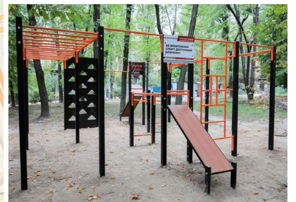
ЗА ІНІЦІАТИВОЮ МЕРА ВІТАЛІЯ КЛИЧКА «БЕЗКОШТОВНИЙ СПОРТ ДОСТУПНИЙ КОЖНОМУ» ВСТАНОВЛЕНО СПОРТИВНІ МАЙДАНЧИКИ «STREET WORKOUT»