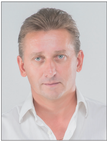
ДЕПУТАТ КИЇВСЬКОЇ МІСЬКОЇ РАДИ АНАТОЛІЙ ШАПОВАЛ