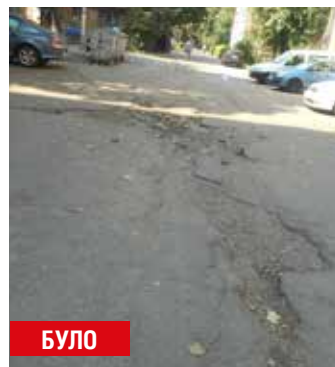
Донця, 19,19-А,19-Б, 21, 21-А (міжквартальний проїзд)