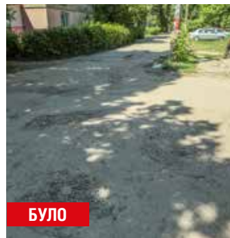
Білецького, 9, 9-А, 9-Б, Донця, 18, 18-А, 18-Б_Гавела, 83-В, 83-Г, 83-Д, 79-Д, 79-Г, 79-В, (міжквартальний проїзд)