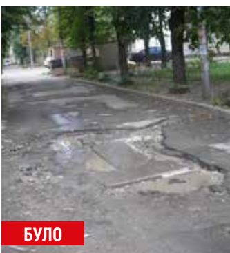
Просп. Відрадний, 16-50 (капітальний ремонт асфальтового покриття прибудинкової території)