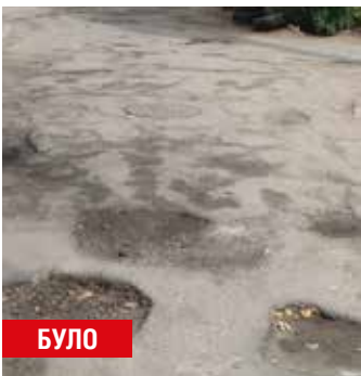
Білецького, 5-5-В (міжквартальний проїзд)