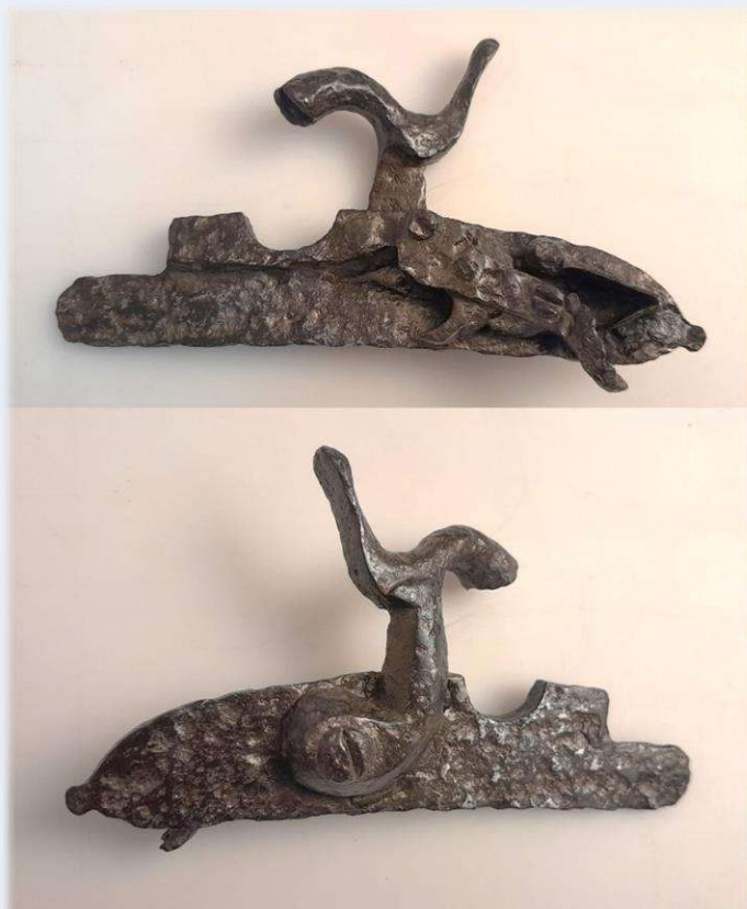
Капсульний замок рушниці XVIII ст.

гетьманства. Музейні предмети після здійснення консерваційно-реставраційних робіт передано до музею.