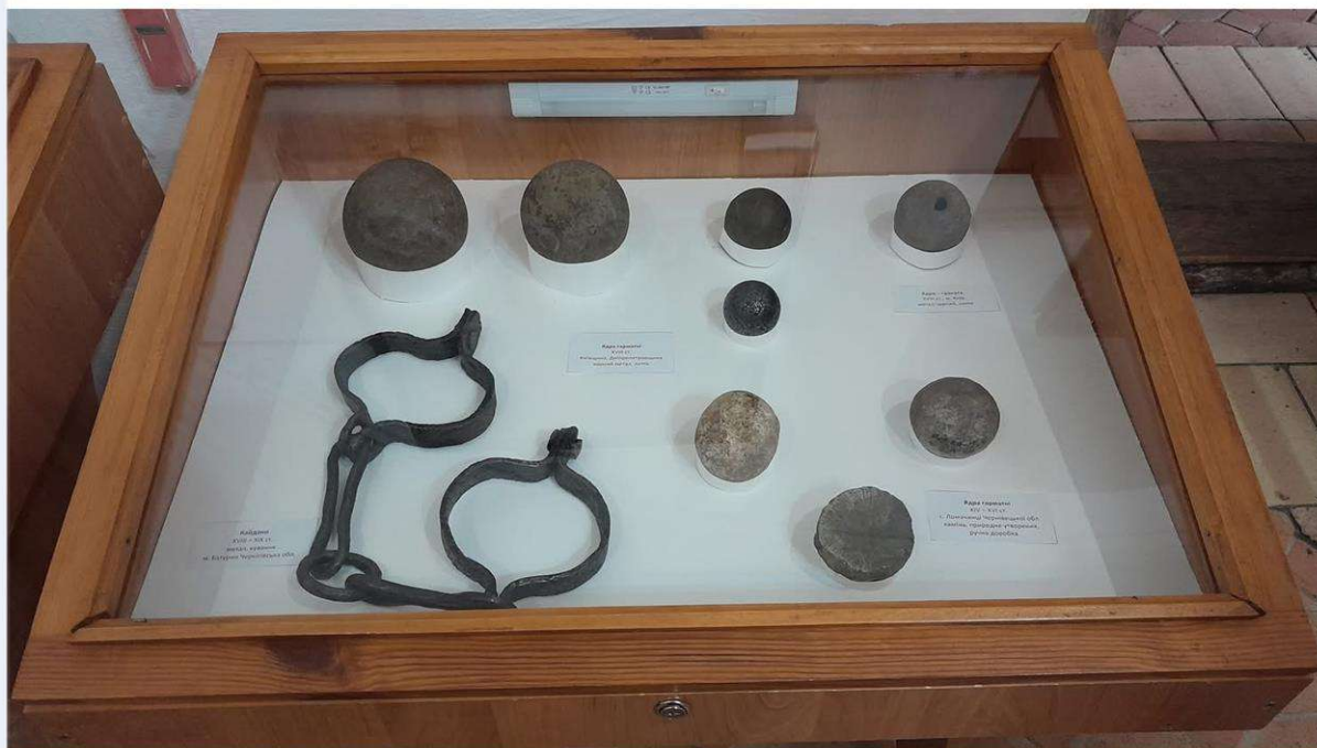
Реставровані музейні предмети в експозиції Музею гетьманства

- Завершено консерваційно-реставраційні заходи щодо 40 предметів нумізматичної колекції (монети до 2005 року випуску) відділу «Музей грошей» Департаменту комунікацій Національного банку України. Фахівцями Центру спільно з експертами Бюро науково-технічної експертизи «Арт-лаб» проведено дослідження щодо хімічного складу монет та отримано експертний висновок (експертиза виконана к.х.н. Оленою Андріановою). Музейні предмети після здійснення консерваційно-реставраційних робіт передано до музею (позапланово, в рамках Договору).