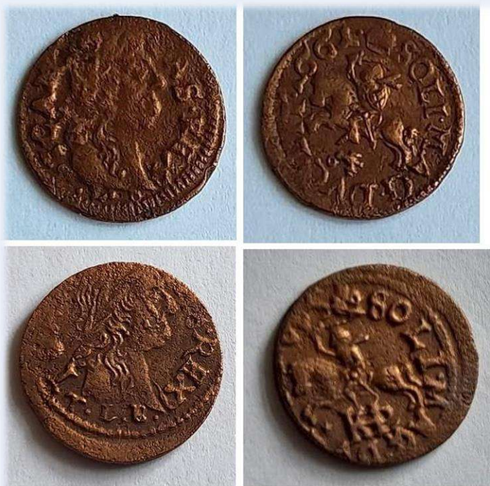
Монети соліди (боратинки) Яна Казимира середини XVII ст. зі скарбу, знайденого на Черкащині та переданого до Музею гетьманства у квітні 2023 року.