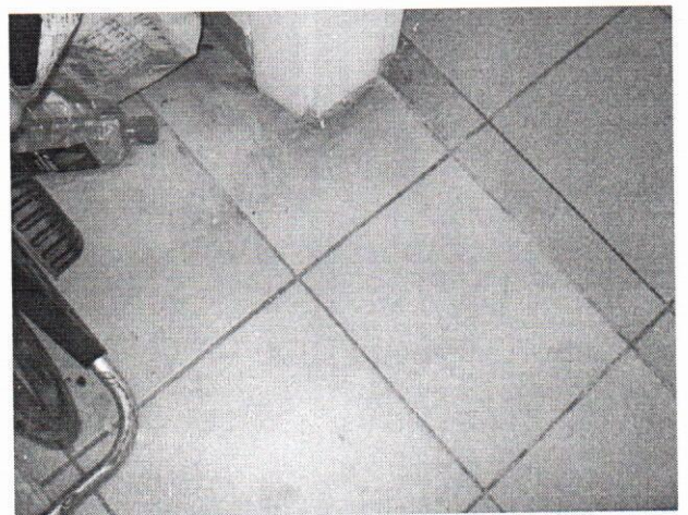
Види 6-10. Загальний вигляд та стан окремих конструктивних елементів об'єкту оцінки.