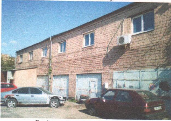
Вхід в оцінювані приміщення