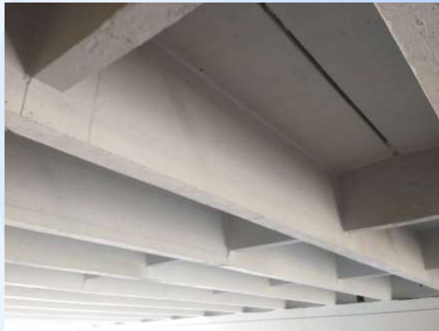
Після виконання робіт