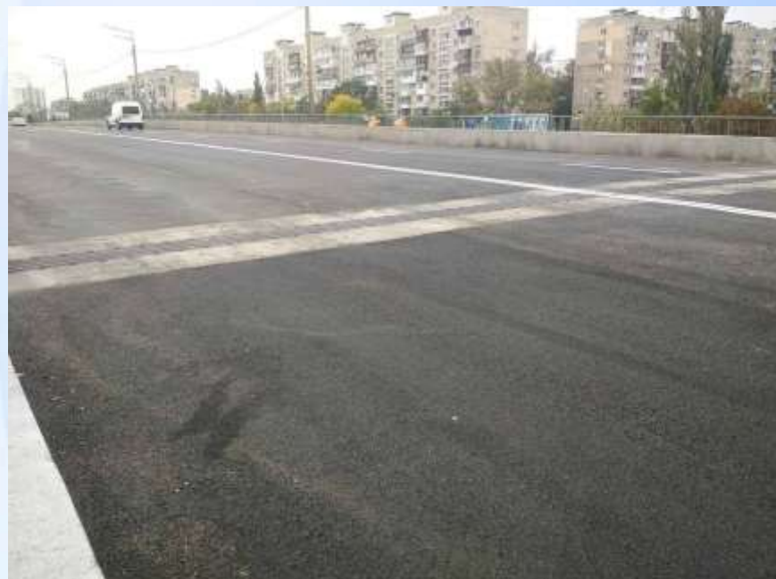
Після виконання робіт