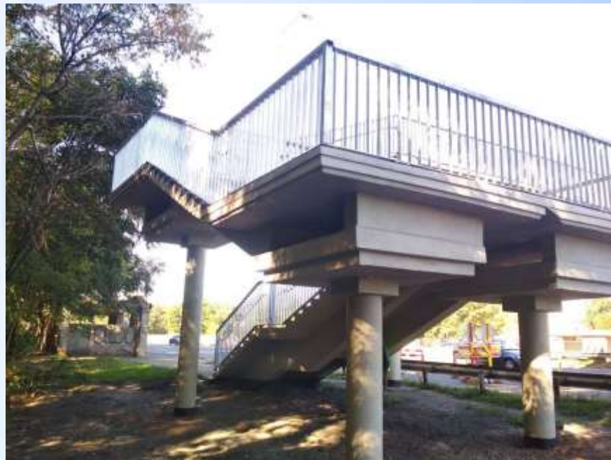
Після виконання робіт