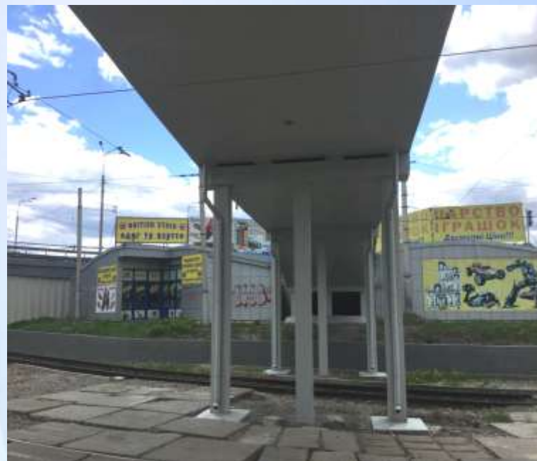
Після виконання робіт