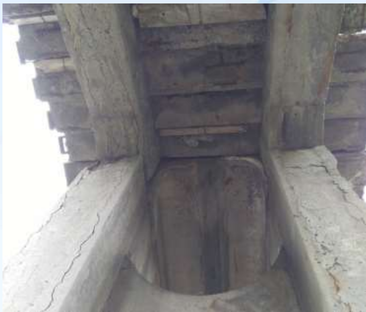
До виконання робіт

Міст пішохідний на перетині вул. Магнітогорської з Святошинсько - Броварською лінією метрополітену поблизу станції метро “Чернігівська”