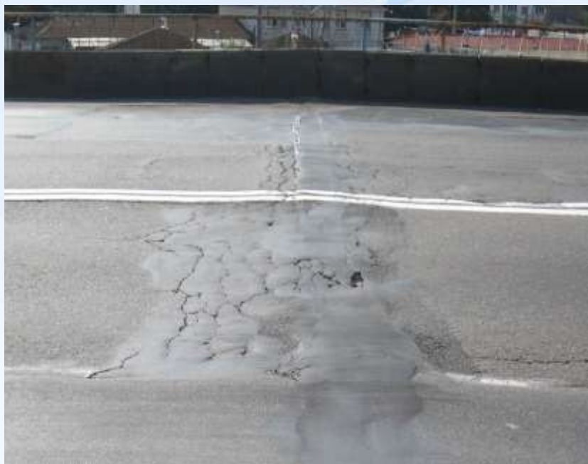
До виконання робіт

Шляхопровід на перетині вул. Братиславської та Ш. Алейхема