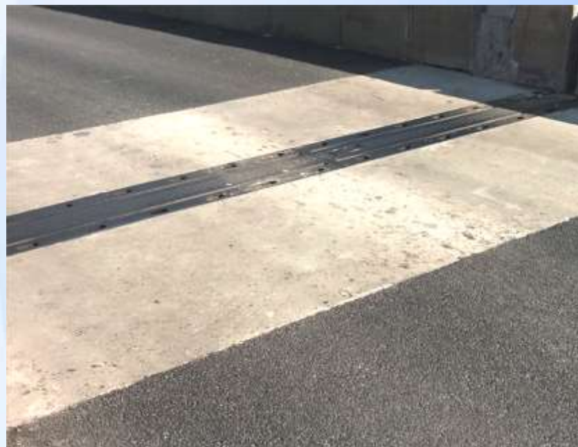
Після виконання робіт