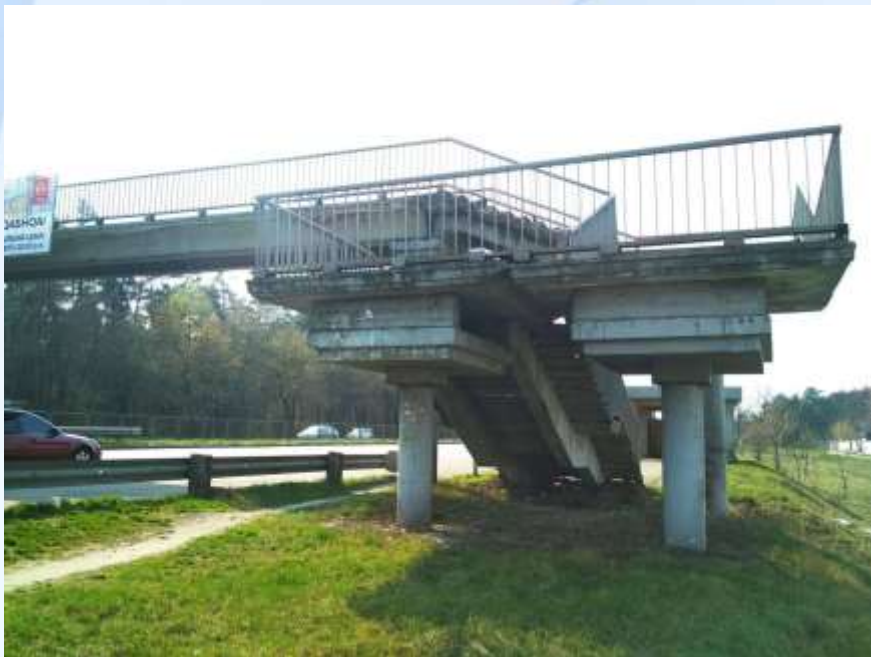
До виконання робіт

Міст пішохідний через Броварський проспект біля примикання автодороги на с. Зазим'є