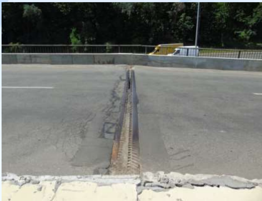
До виконання робіт

Естакадний з'їзд з Дніпровського узвозу на Набережне шосе біля станції метро “Дніпро”