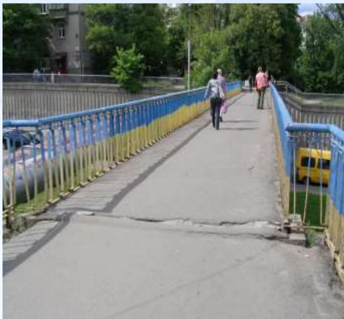
До виконання робіт

Міст пішохідний на перетині вул. Борцагівської та вул. В. Гетьмана (вул. Індустріальної) біля шляхопроводу (код-94)