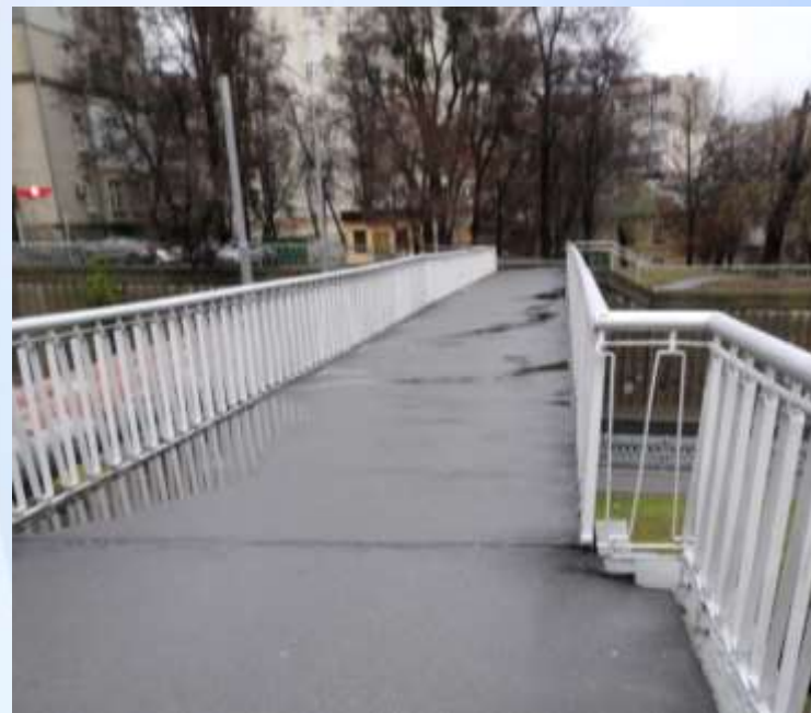
Після виконання робіт