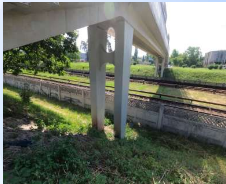
Після виконання робіт