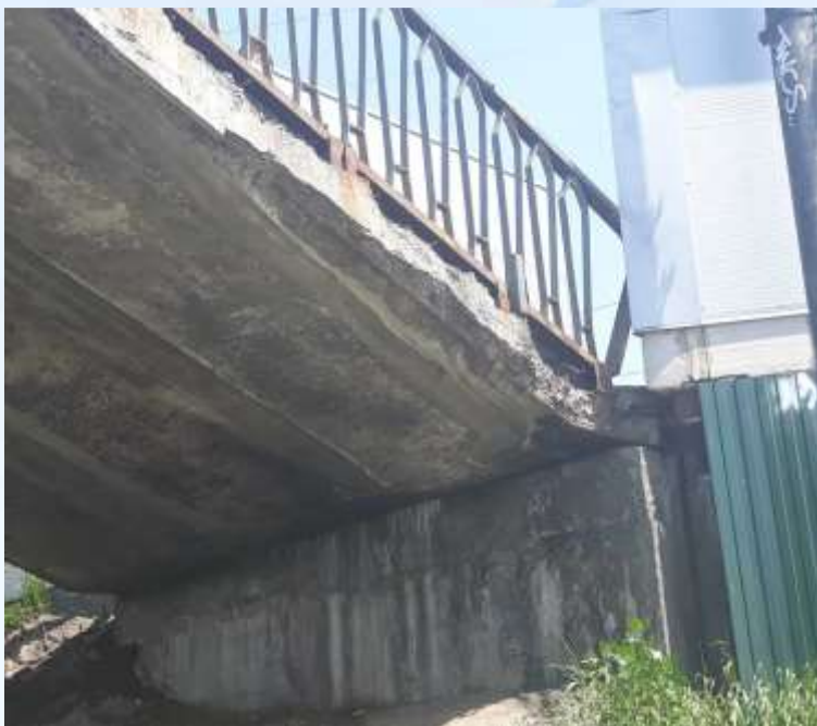
До виконання робіт

Міст пішохідний на перетині проспекту Леся Курбаса та вул. Г. Юри