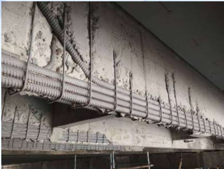
До виконання робіт

Шляхопровід Ковельський через залізничні колії по проспекту Перемоги