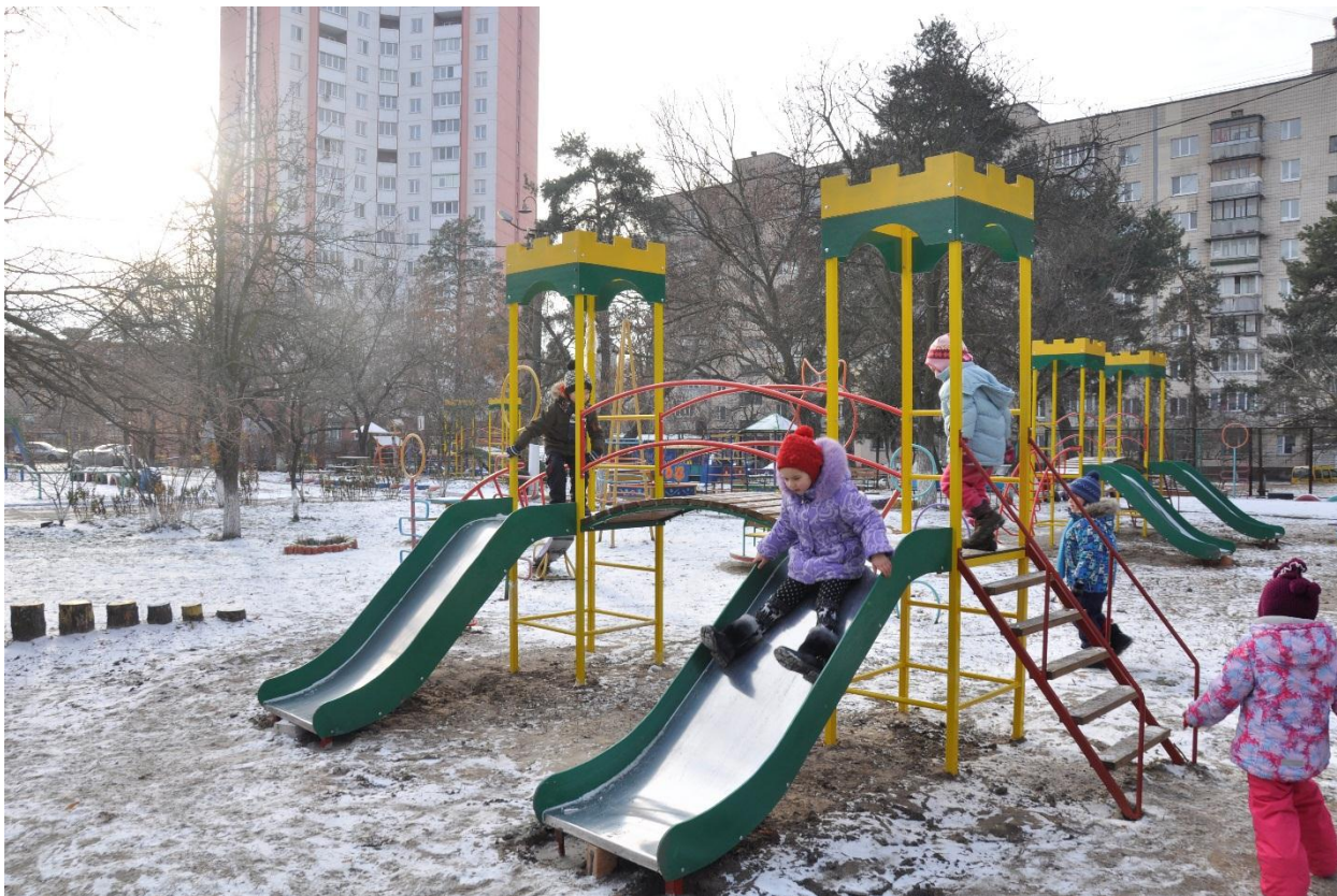
Встановлено 15 дитячих майданчиків на території дитячих садків № 700, 701, 702, 703 та 455