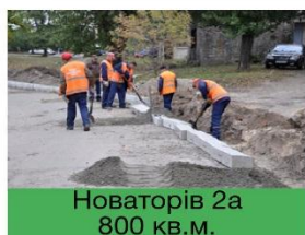
Новаторів 2а 800 кв.м.

ОНОВЛЕНО 6700 КВАДРАТНИХ МЕТРІВ АСФАЛЬТНОГО ПОКРИТТЯ