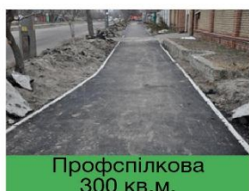
Профспілкова 300 кв.м.