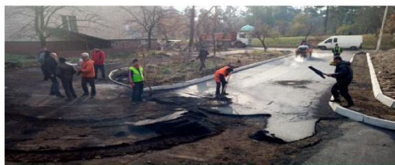
Марганецька 24, Алма-Атинська 109 - 1700 кв.м.

ОНОВЛЕНО 6700 КВАДРАТНИХ МЕТРІВ АСФАЛЬТНОГО ПОКРИТТЯ