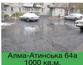
Алма-Атинська 64а 1000 кв.м.