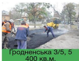
Гродненська 3/5, 5 400 кв.м.