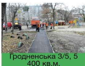
Гродненська 3/5, 5 400 кв.м.