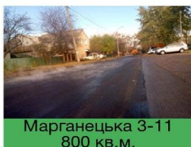
Марганецька 3-11 800 кв.м.