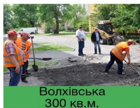
Волхівська 300 кв.м.