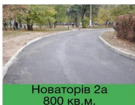
Новаторів 2а 800 кв.м.