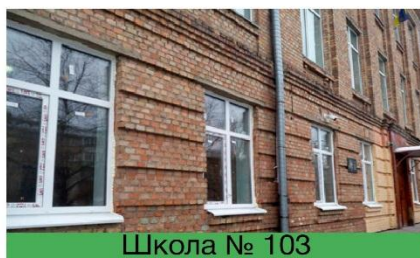
Школа № 103