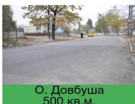
О. Довбуша 500 кв.м.