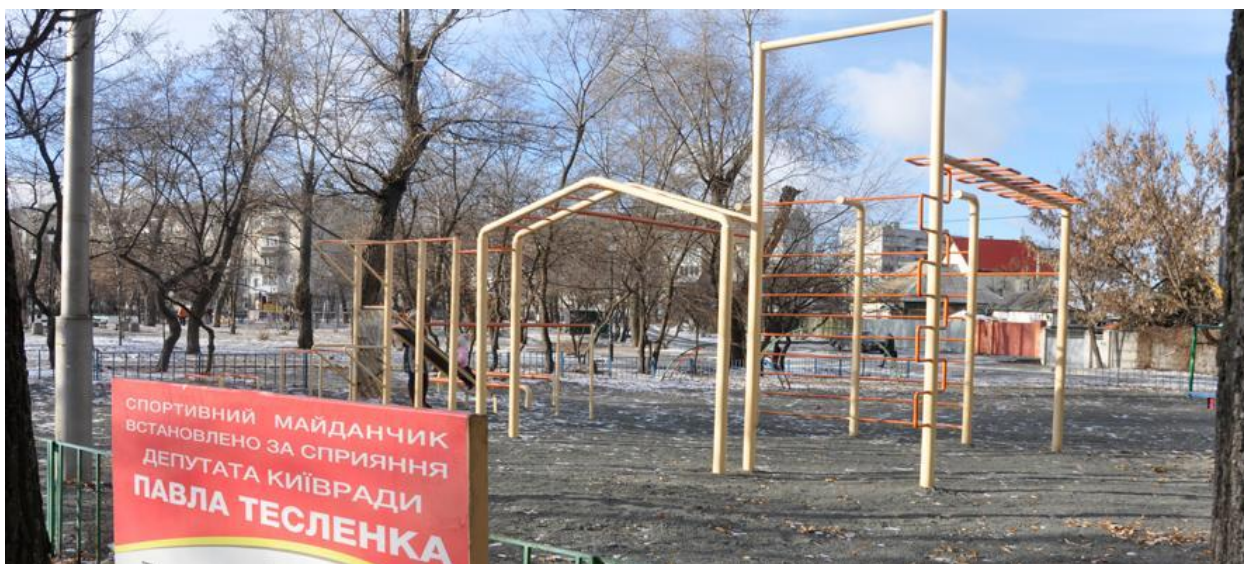
Встановлено три спортивних майданчики за адресою Новаторів 2А, Алма-Атинська 39А та 101А.