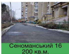
Сеноманський 16 200 кв.м.