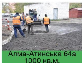
Алма-Атинська 64а 1000 кв.м.