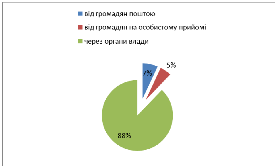
Рис. 2. Кількість звернень громадян, що надійшли на адресу Департаменту промисловості та розвитку підприємництва за 1 квартал 2019 рік в розрізі кореспондентів (звідки надійшли в %).

Із загальної кількості звернень, які надійшли до Департаменту за звітний період 101 звернення (88% від загальної кількості) були адресовані Київській міській державній адміністрації та 14 звернень (12%) були надані особисто, через засоби поштового зв'язку або надіслані через електронну пошту до Департаменту (рис. 2).