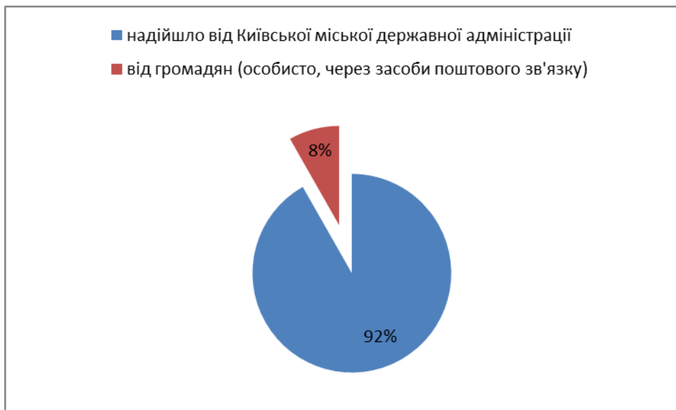
Рис. 2. Кількість звернень громадян, що надійшли на адресу Департаменту промисловості та розвитку підприємництва за 1 півріччя 2019 рік в розрізі кореспондентів (звідки надійшли в %).

Із загальної кількості звернень, які надійшли до Департаменту за звітний період 223 звернення (92% від загальної кількості) були адресовані Київській міській державній адміністрації та 20 звернень (8%) були надані особисто, через засоби поштового зв'язку або надіслані через електронну пошту до Департаменту (рис. 2).